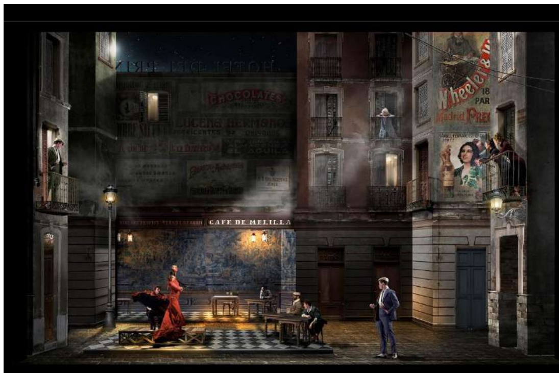
Boceto de Nicolás Boni para la escenografía de La verbena de la Paloma

*Nuria Castejón es directora de escena y coreógrafa de 'La verbena de la Paloma'