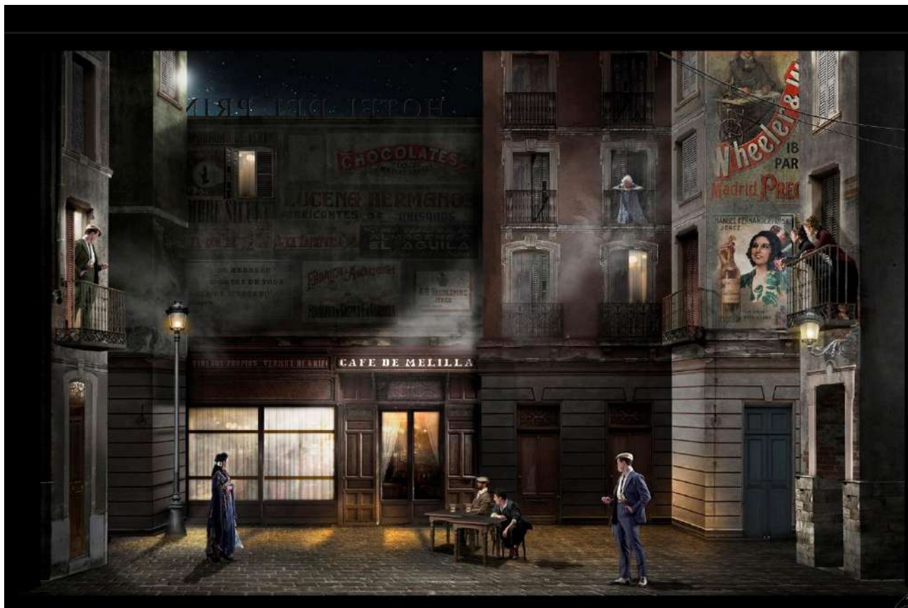
Boceto de Nicolás Boni para la escenografía de La verbena de la Paloma

Bretón, como compositor, está interesado en la tradición musical europea, «y por eso aquí afronta el desafío de hacer una obra profundamente popular con raíces del folclore madrileño, y enlazar todo de una manera magistral». Ese es el secreto de la enorme acogida de esta obra desde su primera función; del encanto que hace que a sus 130 años mantenga la frescura y jovialidad de antaño, y que el público de toda condición la reciba siempre con renovado entusiasmo. Como el regalo que es.