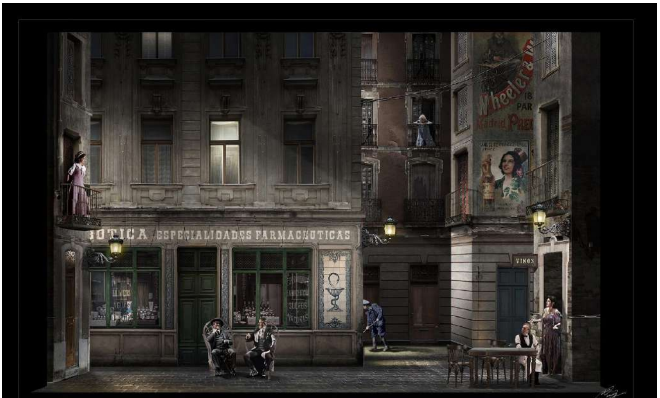
Boceto de Nicolás Boni para la escenografía de La verbena de la Paloma