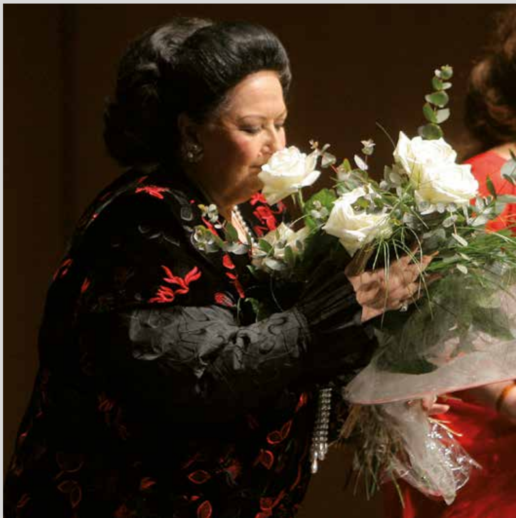
Montserrat Caballé ofreció un recital en Baluarte el 15 de enero de 2008. Arriba, la dedicatoria que la soprano dejó en el Libro de Firmas del auditorio pamplonés.