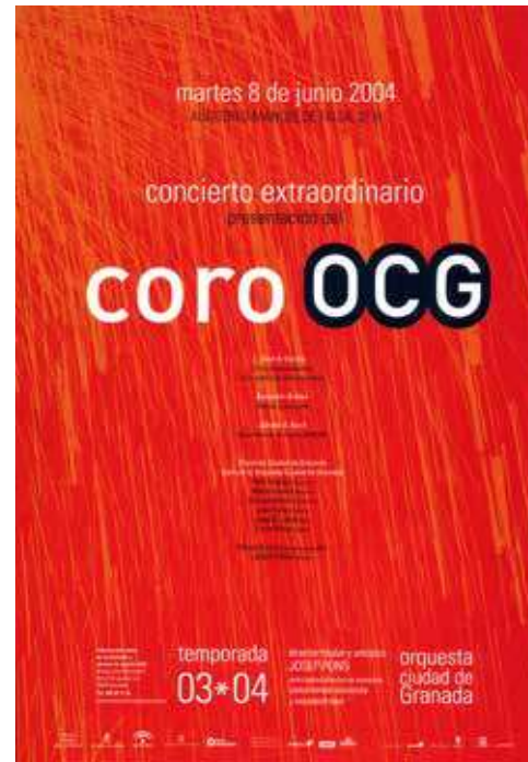
Cartel del concierto de presentación del Coro OCG / 8 junio 2004