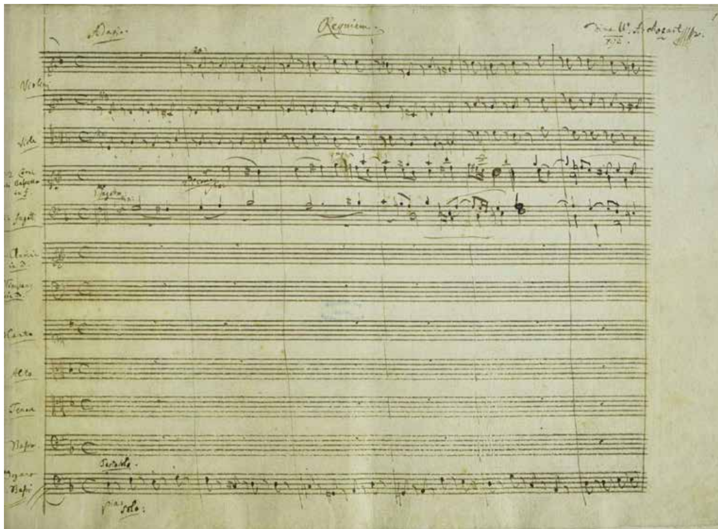
Primera página de la partitura original del Réquiem en Re menor, K 626. Biblioteca Nacional de Austria.