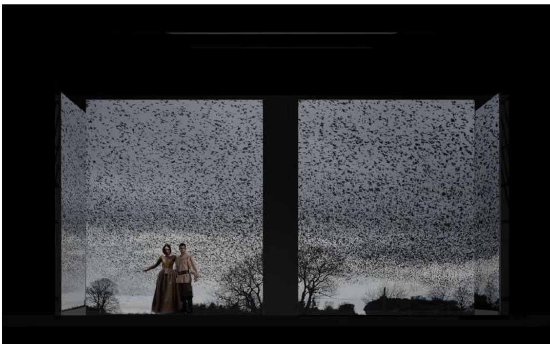
© Boceto de Daniel Bianco para la escenografía de El caballero de Olmedo