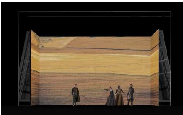
© Boceto de Daniel Bianco para la escenografía de El caballero de Olmedo