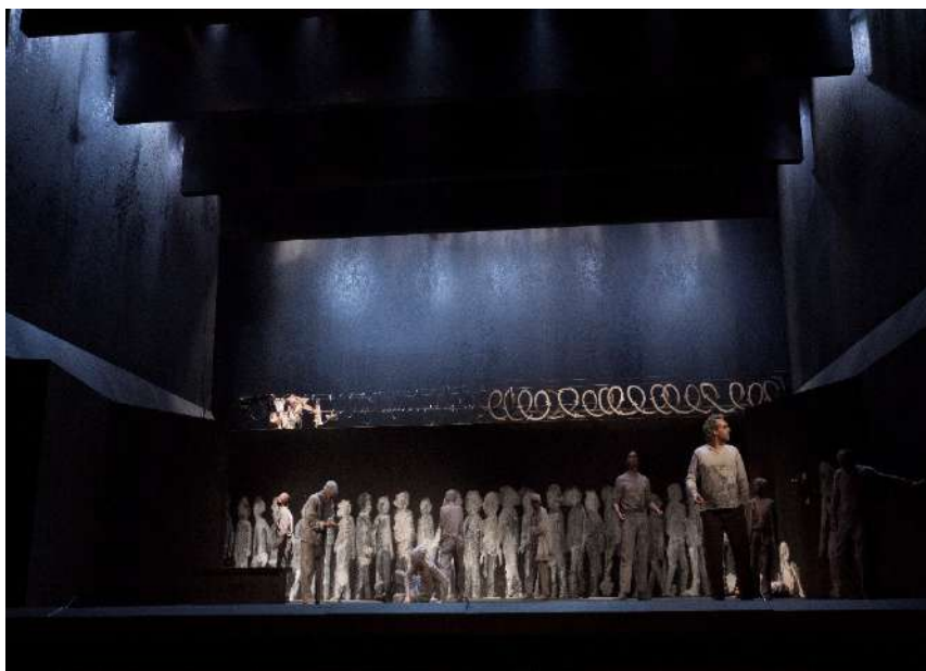
Estreno escénico de ' Juan José ' en febrero de 2016

vestuario —con la colaboración de varios talleres especializados—, Enrique Marty con las pinturas que se verán en escena y Denise Perdikidis con el movimiento escénico; la dirección de la reposición corre a cargo de Jorge Torres, colaborador de Plaza.