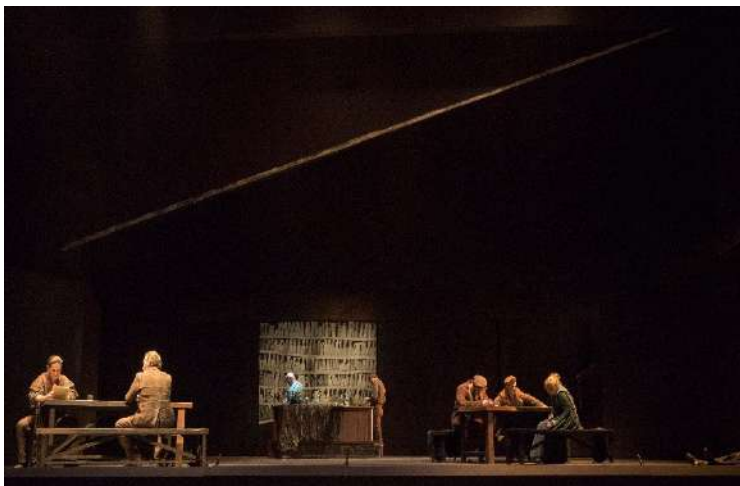
Estreno escénico de ' Juan José ' en febrero de 2016