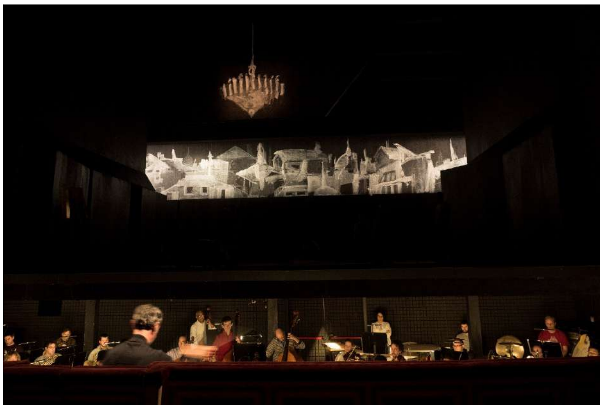
Ensayo de 'Juan José' para el estreno escénico de febrero de 2016

Materiales del Archivo Musical de Pablo Sorozábal (Madrid, 1969)