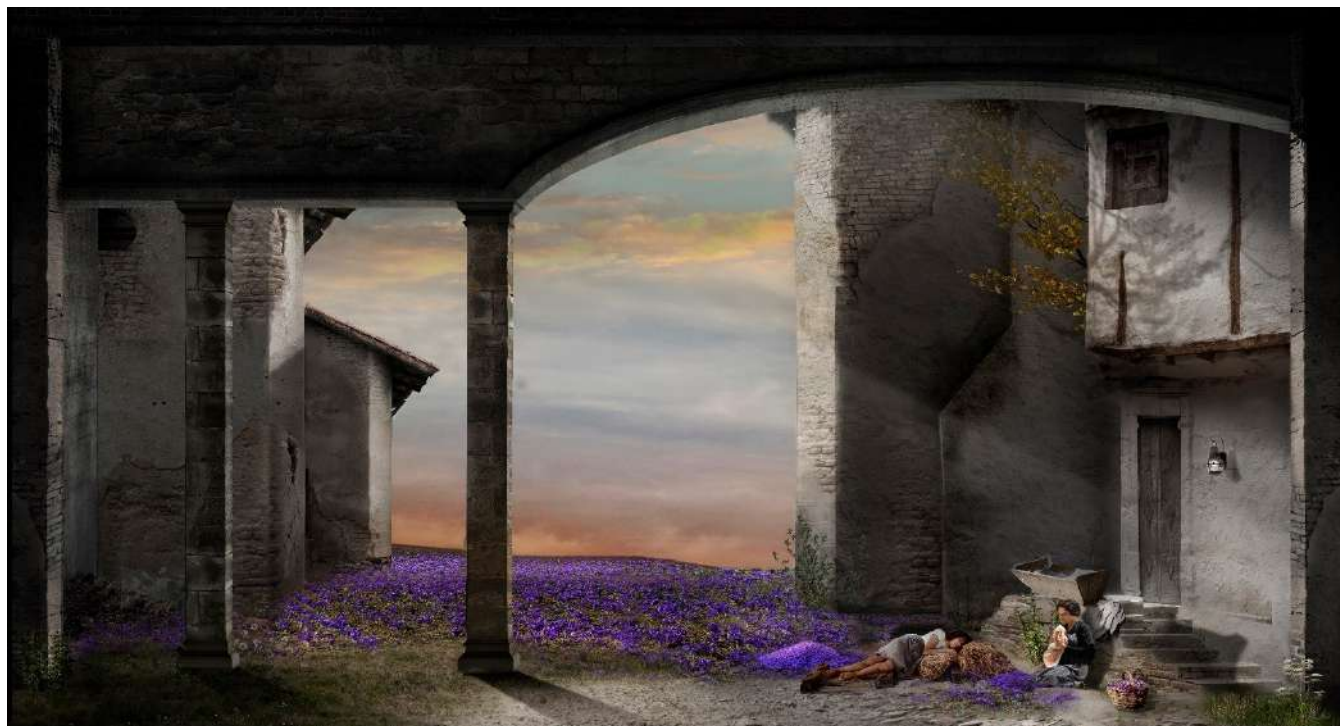
© Boceto de Nicolás Boni para la escenografía de La rosa del azafrán