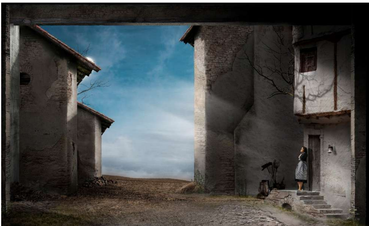
© Boceto de Nicolás Boni para la escenografía de La rosa del azafrán